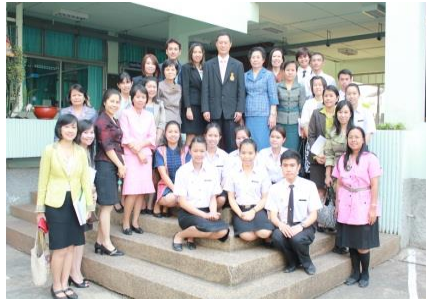
กิจกรรม การประเมินคุณภาพภายนอกระดับสถาบัน โดย สำนักงานรับรองมาตรฐานและประเมินคุณภาพการศึกษา